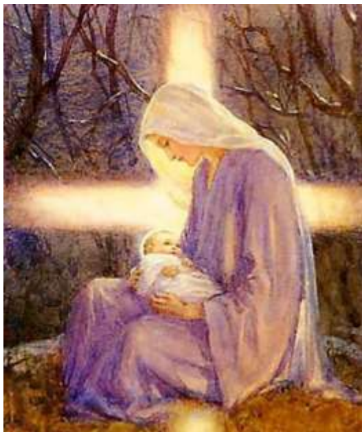
1 er janvier 2022 Sainte Marie, Mère de Dieu

Journée Mondiale de la Paix qui a été établie par le Pape Paul VI en 1968.