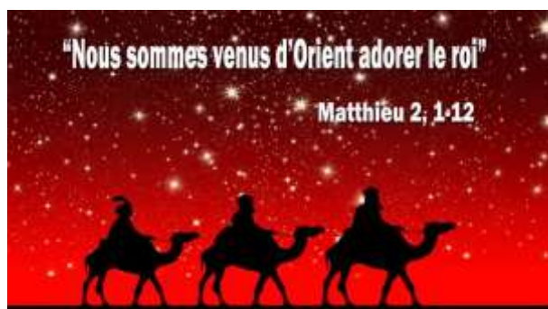
De semaine en semaine 2 janvier 2022 Épiphanie du Seigneur